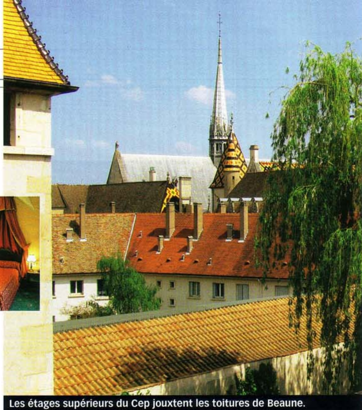
Les étages supérieurs du Cep jouxtent les toitures de Beaune.