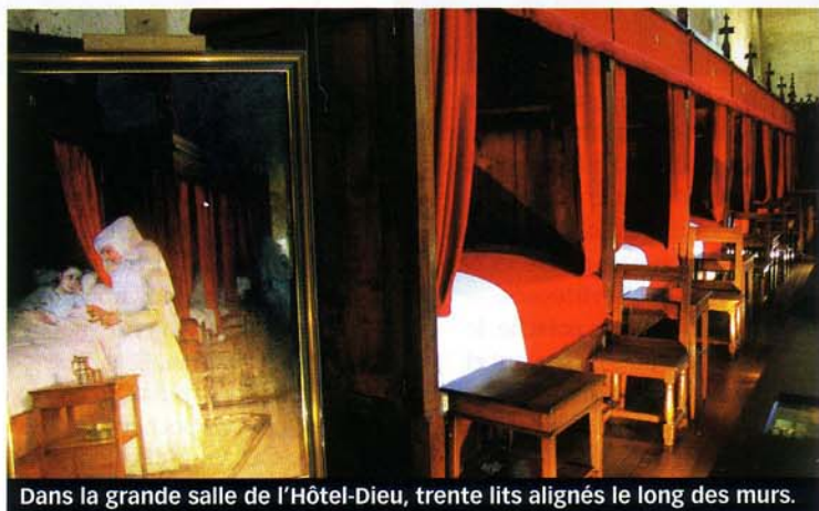
Dans la grande salle de l'Hôtel-Dieu, trente lits alignés le long des murs.

Quel que soit le trajet choisi, il faut visiter l'Hôtel-Dieu, où les bonnes sœurs se dévouaient jusqu'en 1971. On y admire le saisissant retable du Jugement dernier , chef-d'œuvre flamand entouré de belles tapisseries.